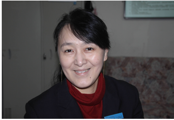
力所能及地她提供帮助。

周凌波介绍了我校2014届毕业生追踪调研基本情况,结合大量图表和详实的数据,分析了学生就业质量、对教学培养质量的反馈和对学生工作及后勤服务质量的反馈。就业质量方面,我校2013、2014届两届毕业生月收入、校友满意度、留学与读研情况、就业现状满意度等指标与全国“211”院校比较具有明显优势;教学培养质量方面,教学满意度、核心课程满意度等指标与前两年比较有所提高,但师生互动、实习与实践环节等指标有待改进,学生就业、留学、读研等不同群体对教学质量评价也表现出了明显差异;学生工作及后勤服务满意度方面,学生评价指标都有所提高,整体向好。(招生就业办公室) 本版编辑 王黎黎