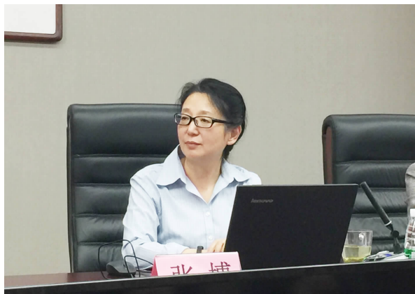
刘又辛先生等,他们在治学、做人方面对您影响最大的是什么?