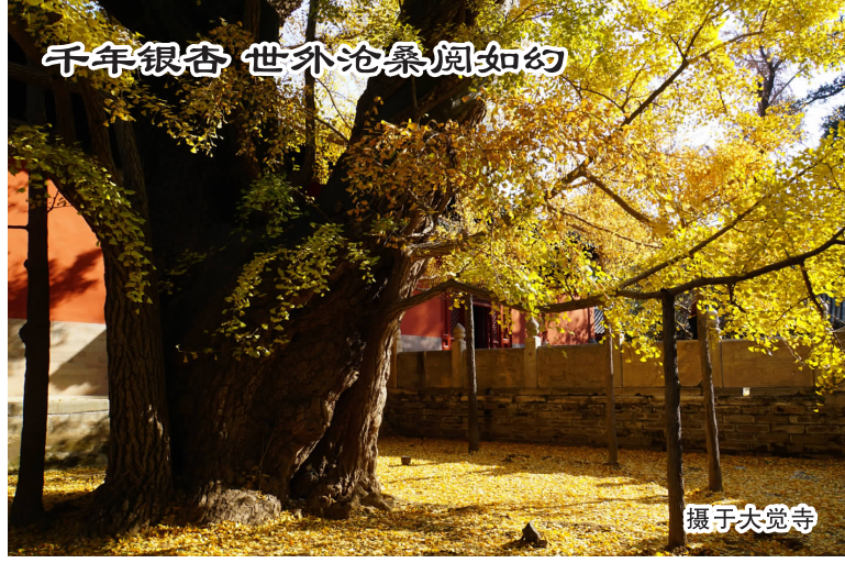
千年银杏 世外沧桑阅如的