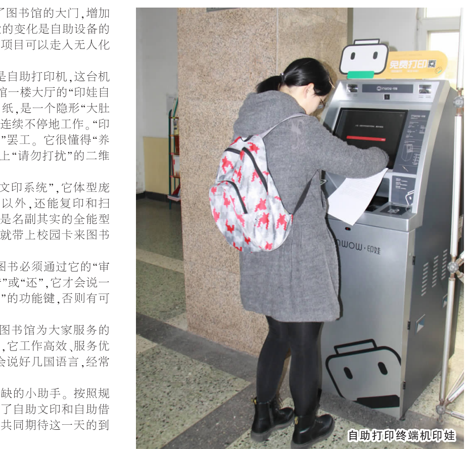
自助打印终端机印娃

2016年图书馆发生了很多变化：安装了门禁系统，改造了图书馆的大门，增加了各种新的数字资源，提供了图书存放和交流的平台等。最大的变化是自助设备的引进，它们的到来颠覆了传统模式，也标志着图书馆许多服务项目可以走入无人化管理的自助时代。