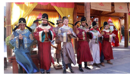
漯河春节民俗文化体验——学作揖