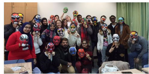
中外学生会社团活动——画京剧脸谱