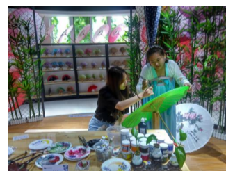
参观河南省漯河市开源集团展览馆